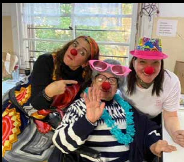
Voluntarias de la Orden junto a residente del Hogar.