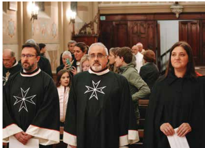
Nuevas Damas y Caballeros de la Asociación.