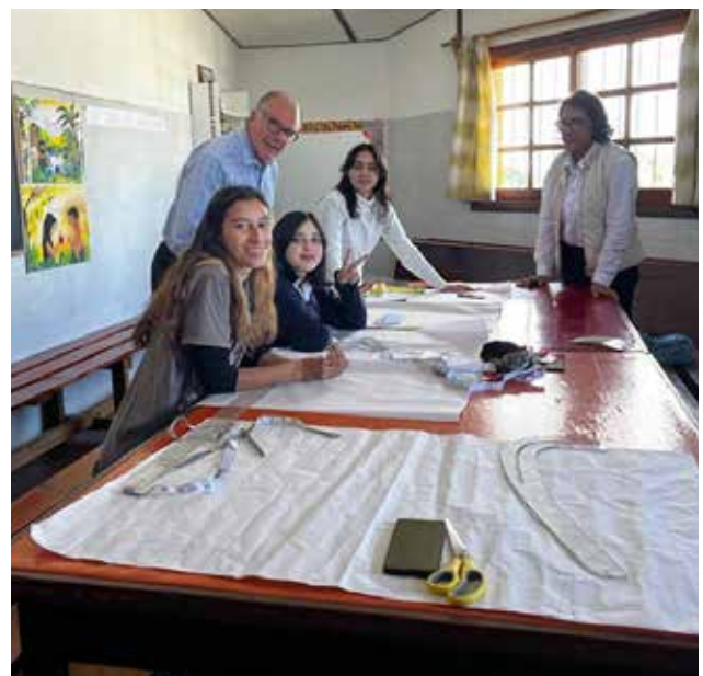
Alumnas y docente del taller de costura.

La Orden de Malta ha donado varias máquinas de coser, impresoras textiles industriales computarizadas, cortadoras de tela, moldes de prendas de vestir, carretes de hilo, y elásticos entre otros insumos.