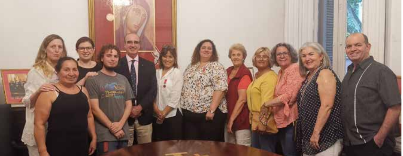
Voluntarios de Montevideo junto al Presidente Santiago Fonseca.

El 5 de diciembre la Asociación celebró el Día Internacional del Voluntario, brindando una distinción por todo el trabajo realizado a su cuerpo de voluntarios de Montevideo y Rosario.